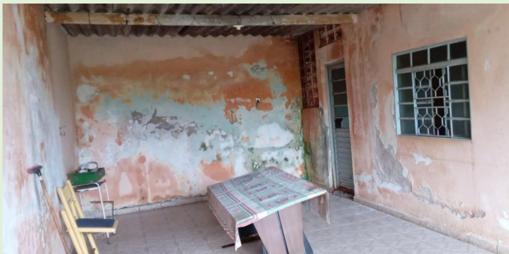
2º OFÍCIO DE AVALIADOR JUDICIAL